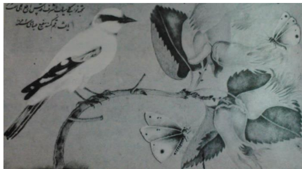
تصویر ۱- نمونه‌ای از گل و مرغ، قرن ۱۱ق (منبع: غضبانیور و آغداشلو، ۱۳۷۶، ۳۵).

رضا عباسی نخستین نقاش دوران صفوی است که در آغاز قرن ۱۱ق/۱۷م، با انتخاب مرغ به نشانه روح، توجه نقاشان پس از خود را به طرف نشانه‌ها و نمادهای مفهومی طبیعت می‌کشاند. آنها با گذشت زمان و دگرگونی‌های تاریخی، متوجه می‌شوند تنها با اشاره به این نشانه‌ها و نمادها امکان دارد از صورت‌های ذهنی و بی‌شکل مفهوم‌های جوهری و عرفانی، شکلی دیدنی و ملموس پدید آورند. تا آغاز دوران زندیه، نقاشی "گل و بلبل" دوران صفویه درگیر تجربه آثار لاکمی می‌شود و مرغ نغمه‌سرا (بلبل)، به مرغ کلی تبدیل می‌شود. در این سال‌های پر آشوب، به نظر می‌رسد، نقاش برای فراموش کردن اوضاع زمانه، همانند اجرای مراسمی آیینی، به نقاشی گل و مرغ می‌پردازد. چون شکل‌های جزئی و فضا سازی کلی آثار این سال‌ها زیر تأثیر نمادها و رمزهای متن‌های عرفانی شکل می‌گیرند (شهادی، ۱۳۸۴، ۱۷).