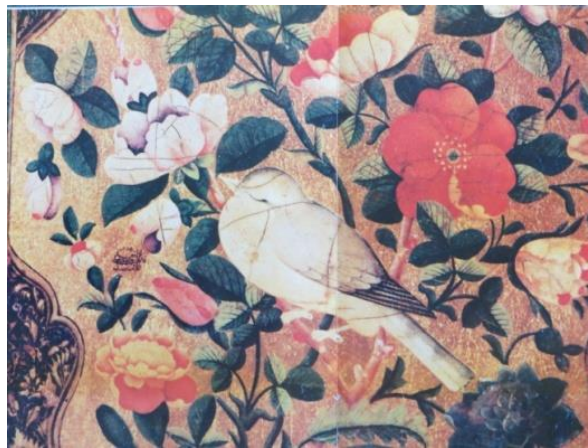
تصویر ۴- نمونه دیگری از مرغ با چشم بسته از آثار آقا لطفعلی صورتگر، قرن ۱۳ق (غضبانپور و آغداشلو، ۱۳۷۶، ۱۳۴)