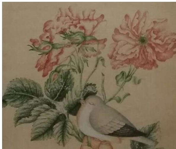
تصویر ۳- بخشی از گل و مرغ آقا لطفعلی صورتگر، قرن ۱۳ق (شهادتی، ۱۳۸۴، ۱۰۶)

در برخی از آثار گل و مرغ (به‌ویژه در آثار آقا لطفعلی صورتگر)، با مرغانی با چشم‌های بسته مواجه می‌شویم که در نگاه اول به‌نظر می‌رسد پرنده‌ای را در حال استراحت یا خواب به‌تصویر کشیده‌اند (تصویر-۳).